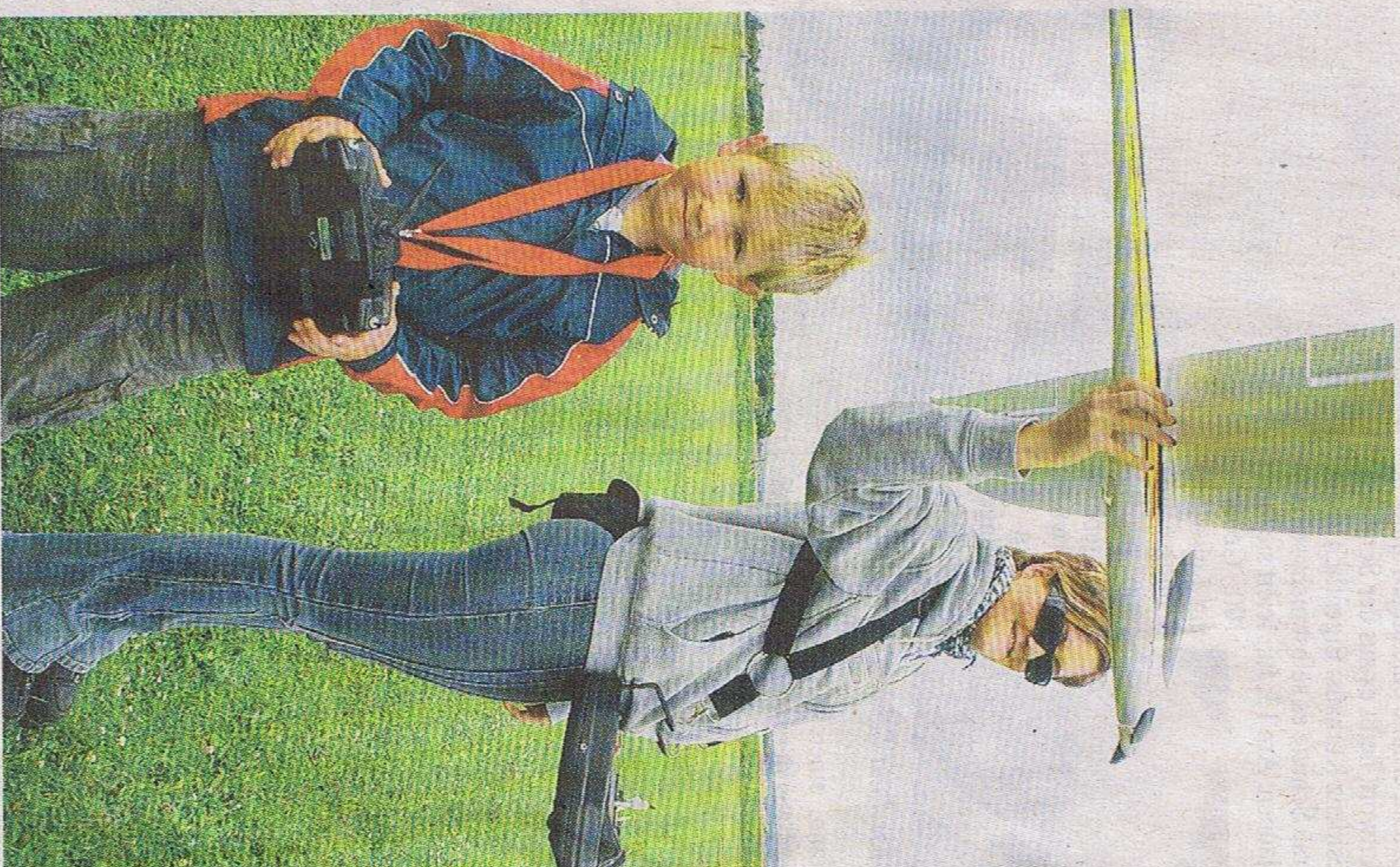
An die Knüppel, fertig los, lautete die Devise auf dem Flugfeld, wo die Ferienkinder ihren Spaß hatten.