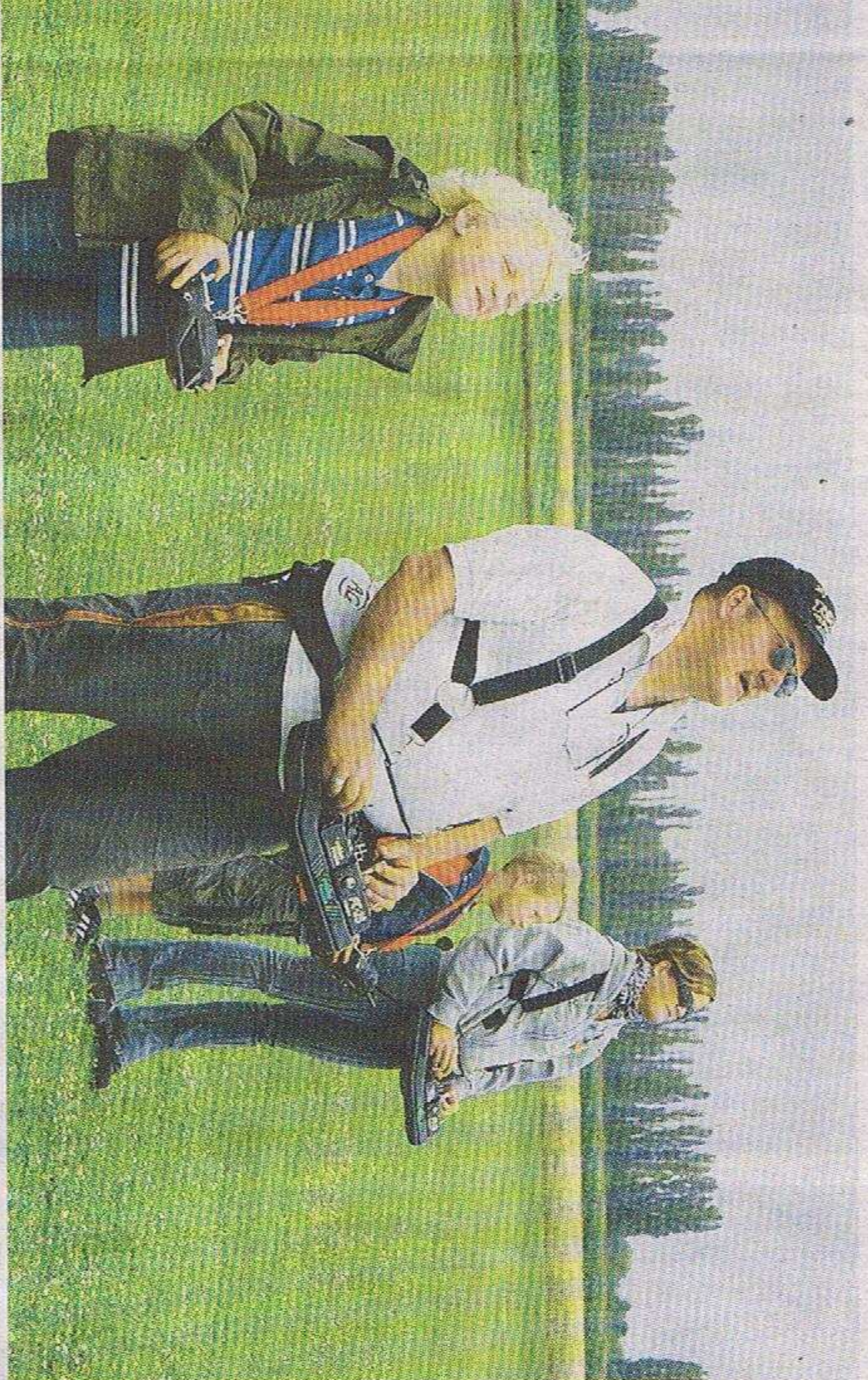
Über eine Lehrer-Schüler-Verbindung zum Steuerpult der Profis vom Aero-Club Rheidt dürfen die Schnupper-Kinder selbst fliegen.